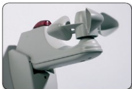
Sol och vind Automatik

Automatiserade solskydd är en effektiv del i bostadens komfort och kontroll, vilket ger dig en känsla av lyx i vardagen. Drifkostnad för ett automatiskt screen är endast några kronor om året.